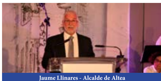
Jaume Llinares - Alcalde de Altea